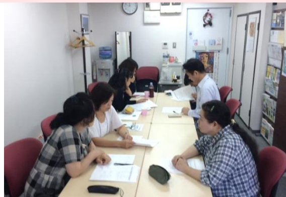
※講座イメージ写真です